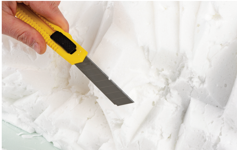
Bearbeiten der Oberfläche der Geländekontur mit einem Cutter Messer bzw. schnitzen des Felsens.