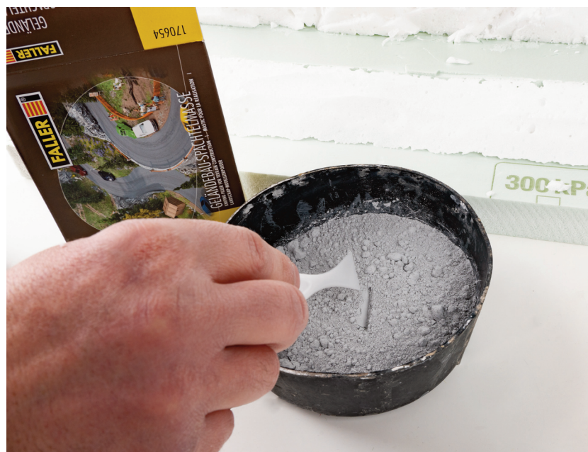
Anrühren der Geländebau-Spachtelmasse Art. 170654.