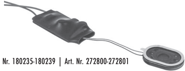
Art. Nr. 180235-180239 | Art. Nr. 272800-272801