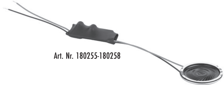
Art. Nr. 180255-180258