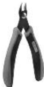
Art. Nr. 170688 Spezial-Seitenschneider

Vloeibare lijm in plastic-flacon met doserbuisje om nauwkeurig te lijmen.