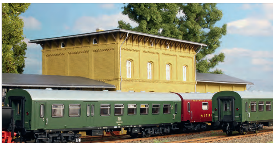
Im Foto oben der Halbgepäckwagen, dahinter die Speisewagenversion.

Alle Piko-Modelle rollen auf fein strukturierten Drehgestellen der Bauart Görnitz V. Die Kupplung könnte enger sein.