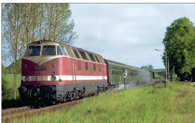
Als typischer Personenzug der DR in den 1980er-Jahren passiert die sechssächsige 118 697 mit Bghw-Wagen den Haltepunkt Friedrichswalde bei Eberswalde. Die Lok heizt (wie gut erkennbar) mit Dampf.

50 Exemplare noch auf den (überarbeiteten) preußischen Regeldrehgestellen der Spenderwagen liefen, erhielten die nachfolgenden 300 Wagen Schwannenhalsdrehgestelle. Im Laufe der Jahre bekamen dann allerdings fast alle Wagen Drehgestelle der Bauart Görlitz V. Die Wagen der letzten Bauserien sowie die Bghw-basierten Halbgepäck- und