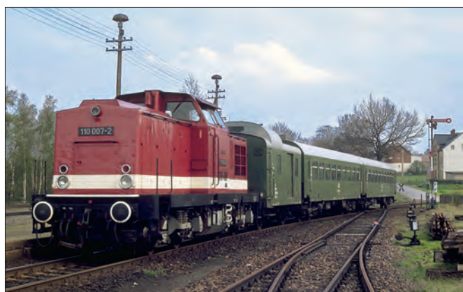
Nicht minder typisch waren Bghw-Wagen in Nebenbahnzügen hinter Dieselloks der Baureihe 110. In Berthelsdorf im Erzgebirge lief (wie so oft) ein Neubau-Packwagen der DR mit.