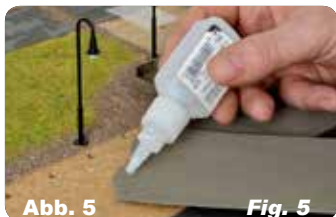
Abb. 5 Fig. 5 Straßenplatten auf der Rückseite mit Kleber einstreichen.

Paste glue on the back of the street plates.