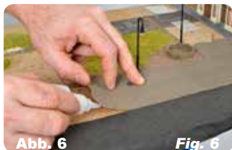
Abb. 6 Fig. 6 Untergrund mit Kleber einstreichen und Straßenplatte leicht andrücken.

Paste glue on the back of the street plates.