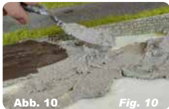
Abb. 10 Fig. 10 Mit einem Spachtel verstreichen und nach Belieben formen.

Abb. 9 Fig. 9 Modellierpaste auftragen. Ist die Modellierpaste zu zäh, können Sie diese mit etwas Wasser vermischen, bis die gewünschte Konsistenz erreicht ist.