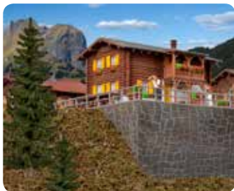
Hang-Fundament Mountain side base