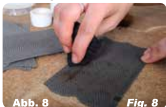
Abb. 8 Fig. 8 Überschüssige Farbe abtupfen. Ergebnis ist ein vorbildgerechtes Kopfsteinpflaster.

To bring out gap apply powder colour with a brush.