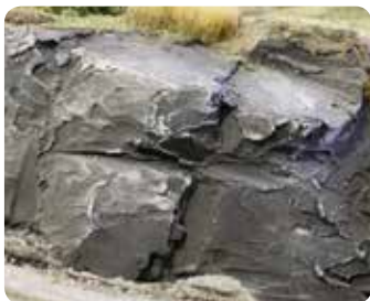
Felsen aus Modellierpaste Rocks created with modelling paste