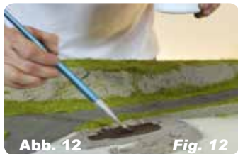
Abb. 12 Fig. 12 Nachträgliches Auftragen der Farbe und Vermischen ist ebenfalls möglich.

Mix with acrylic paint to get desired shade.