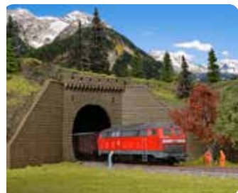
Tunnelportal mit Stützwänden Tunnel portal with retaining walls