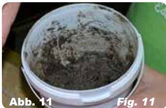
Abb. 11 Fig. 11 Vermischen Sie die Acrylfarbe mit der Modellierpaste für den gewünschten Farbton.

Put on the modelling paste. To get the desired consistency mix it with some water.