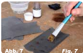
Abb. 7 Fig. 7 Heben Sie die Fugen hervor, indem Sie Farbpulver mit einem Pinsel auftragen.

To bring out gap apply powder colour with a brush.