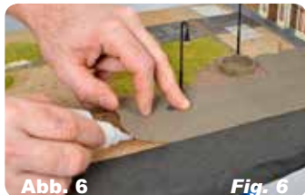
Abb. 6 Fig. 6 Untergrund mit Kleber einstreichen und Straßenplatte leicht andrücken.

Paste glue on the back of the street plates.