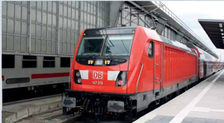
Die 147 019 der DB Regio im Karlsruher Hauptbahnhof.

Die Traxx-Lokomotiven von Bombardier gehören zu einer der erfolgreichsten Typenfamilie in Europa und sind auch langfristig auf deutschen Gleisen unverzichtbar. 2013 unterzeichneten die DB AG und Bombardier einen Rahmenvertrag, der Lieferungen von bis zu 450 weiteren Traxx-Lokomotiven vorsieht. Bisher wurden aus diesem Rahmenvertrag über 100 Loks der Baureihe 187 für DB Cargo und 20 Loks Traxx P160AC3 als BR 147 für DB Regio abgerufen. Seit Januar 2017 stehen Loks der BR 147 mit Bn- und Doppelstockwagen im Einsatz. Weitere Maschinen sollen vor IC und IC2 Zügen eingesetzt werden und sind deshalb im weiß-roten Design von DB Fernverkehr lackiert und als BR 147.5 bezeichnet.