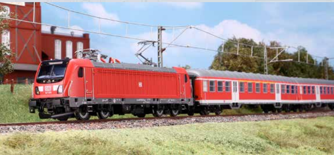
Die BR 147 mit Nahverkehrswagen der Deutschen Bahn.