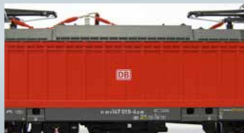
Seitenfläche mit „Rippen“