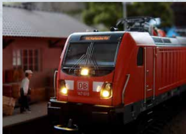
Die PIKO BR 147 auf ihrem abendlichen Weg in Richtung Karlsruher Hauptbahnhof.