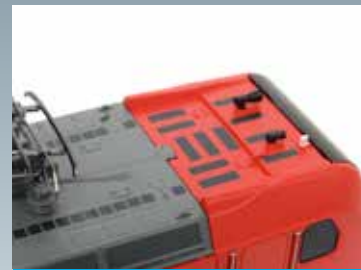
Neue Anordnung der Makrofone