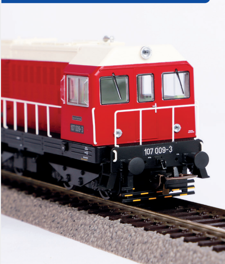
Filigrane Geländer und Details