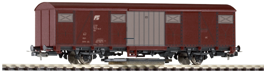
58919 Carro per pulizia binari Gbs FS Ep. IV