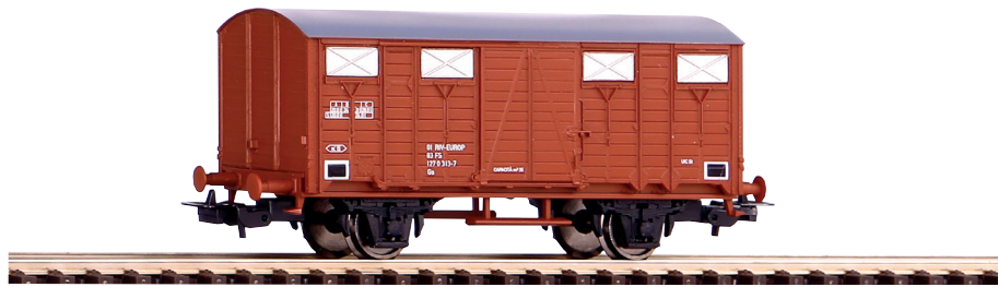
58911 Carro chiuso FS Ep. IV