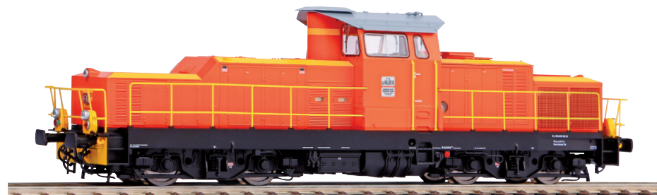
52840 Locomotiva Diesel Gruppo D.145 FS Ep. IVb 52841 ~ Locomotiva Diesel Gruppo D.145 FS Ep. IVb

I primi esemplari della serie D.145 vennero utilizzate nel servizio per treni cantiere; queste locomotive hanno inoltre operato, ad esempio, nelle zone di Torino, Bologna, Roma, Reggio Calabria, Messina e Napoli. Nel 2017, restavano ancora in servizio 41 macchine del Gruppo, assegnate a Mercitalia Rail, la divisione merci di Ferrovie dello Stato Italiane.