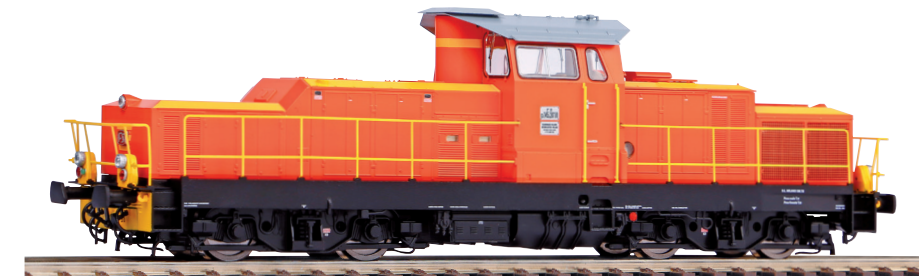
52842 Locomotiva Diesel Gruppo D.145 FS Ep. IVb 52843 ~ Locomotiva Diesel Gruppo D.145 FS Ep. IVb

Le luci dei fanali, del tipo a LED, passano dal colore bianco al rosso in base al senso di marcia. L'illuminazione della cabina è di serie, come anche le luci di coda funzionanti in base al senso di marcia, ed entrambe sono attivabili digitalmente tramite decoder PluX22. Il motore a cinque poli, grazie ai due volani, assicura eccellenti caratteristiche di marcia. Il modello è dotato di interfaccia digitale PluX22 ed è predisposto per essere agevolmente equipaggiato con Sound ed altoparlante delle maggiori dimensioni possibili. La versione a corrente alternata presenta di serie un apposito PIKO SmartDecoder 4.1 PluX22 compatibile con mfx.