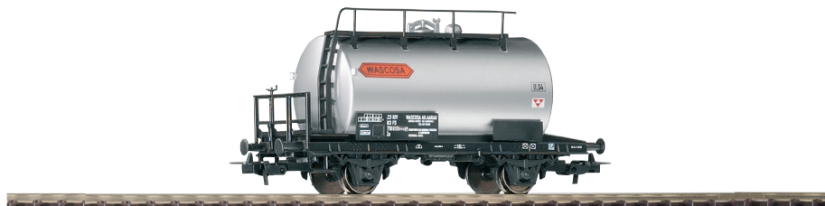
58777 Carro cisterna Wascosa Ep. IV