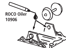
ROCO Oiler 10906

Les pièces de finition illustrées sont à monter par le modéliste. Le jeu de pièces peut comprendre d'autres pièces (non illustrées) qui sont destinées à autres versions du modèle et qui sont superflus à la variante présente.