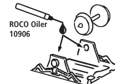
ROCO Oiler 10906

Les pièces de finition illustrées sont à monter par le modéliste. Le jeu de pièces peut comprendre d'autres pièces (non illustrées) qui sont destinées à autres versions du modèle et qui sont superflus à la variante présente.