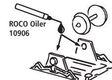
ROCO Oiler 10906

Les pièces de finition illustrées sont à monter par le modéliste. Le jeu de pièces peut comprendre d'autres pièces (non illustrées) qui sont destinées à autres versions du modèle et qui sont superflus à la variante présente.